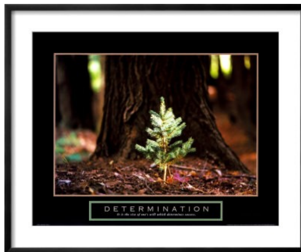
Determinazione - piccolo pino

proposte per sostenere la determinazione dei bambini e delle bambine a crescere e imparare